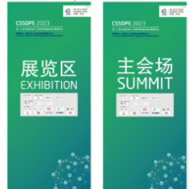
| 展览区、会议区指示牌 |